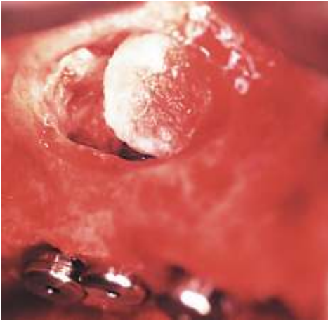
Abb. 2c: Bei dieser Patientin wurde das fasziale Knochenfenster anschließend zusätzlich mit TCP Granulat abgedeckt, bevor eine bioresorbierbare Flüssig-Membran zum Einsatz kam. Die Einheilung der Implantate erfolgte verdeckt.

Einige der stark röntgenopaken -TCP-Partikel wurden weiterhin auf das Dach des Augmentats eingebracht, um eine radiologische Nachkontrolle zu unterstützen.