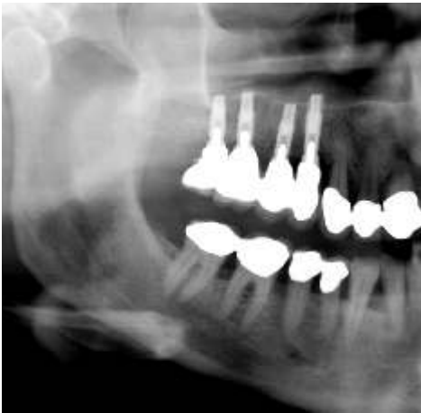
Abb. 5: Radiologische Kontrolle (OPG) sechs Monate nach Transplantation von BioSeed®-Oral Bone und simultaner Implantation; die Implantate konnten voll belastet werden.

Gut fünf Monate nach Sinusbodenaugmentation wurden die Implantate freigelegt; alle Implantate zeigten sich klinisch fest; eine Periotest-Messung, die für alle vier Implantate Werte zwischen -3 und -4 ergab, bestätigte dies. Sechs Monate nach Transplantation zeigte sich gemäß Kontroll-OPG ein relativ zum Zeitpunkt vor Behandlung wesentlich erhöhter vertikaler Knochenbestand von 16 mm (rg. 14), 14 mm (rg. 15), 14 mm (rg. 16) und 13 mm (rg. 17), der die Bekronung und Erstbelastung erlaubte.