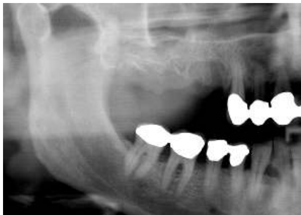
Abb. 1 OPG zum Zeitpunkt des Behandlungsbeginns (Tag der Biopsie).

Nach parodontaler Vorschädigung der Zähne, die mehrmals parodontal vorbehandelt worden waren, zeigten sich die Zähne 14, 15, 16 und 17 auf Grund des starken Knochenabbaus nicht mehr erhaltungsfähig und wurden daher extrahiert.