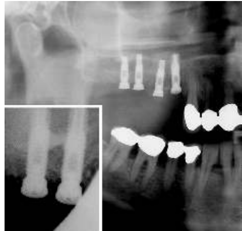
Abb. 3: OPG und Radiovisiographie von Regio 14 und 15 (links unten) drei Monate nach Transplantation.